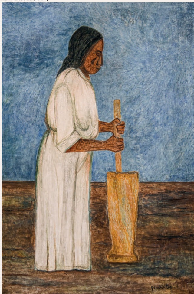
La morteadada (1952)

Animamos a participar e interactuar con las distintas instalaciones y recursos que se encuentran en sala y en la página web para poder ser parte de la vida de este proyecto.