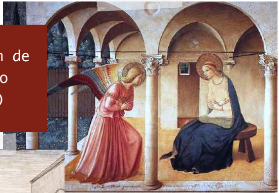
La Anunciación de Fra Angelico (1395-1455)