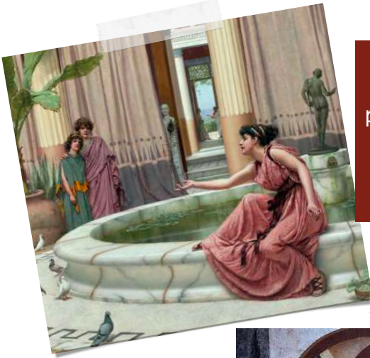
Obra prerrafaelista del artista Godward (1861 - 1922)