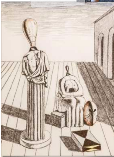
Giorgio de Chirico (1888-1978)