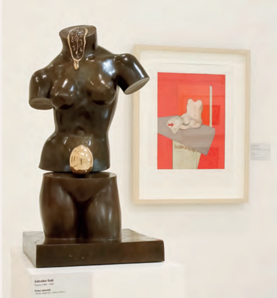
Salvador Dalí, Venus Spatiale , 1984 © Salvador Dalí, Fundació Gala-Salvador Dalí, VEGAP, Marbella, 2023