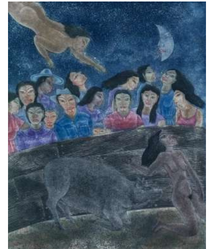
Juan Alcázar, Guadalupe Etla (Oaxaca), El rodeo (1988)

Sin embargo, a pesar de esta su modernidad, el vínculo con la tradición indígena sigue patente en las referencias y la representación de la flora y fauna local en sus obras, incluso en las más alejadas de la forma.