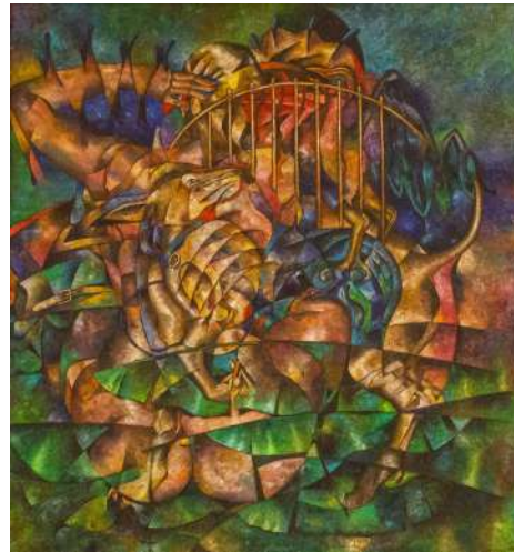
Luis Zárate, Santa Catarina Cuanana (Oaxaca), Sueño tropical (1984)

En estas obras, las escenas cotidianas se entremezclan con la tradición cultural zapoteca e impregna sus obras de fantasía. Colores vivos, tonos tierra, ocre y rojizos, predominan en las obras de estos artistas, los cuales se han relacionado con el Realismo Mágico.